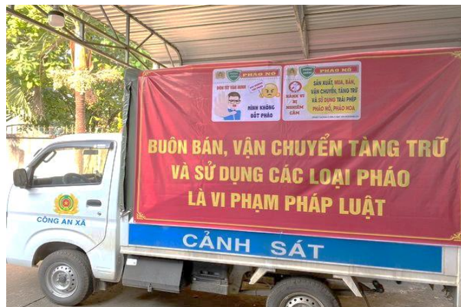
Công an xã Phú Lập thực hiện tuyên truyền về pháo lưu động

hại của việc mua bán, vận chuyển, tàng trữ, sử dụng các loại pháo nổ; nhận thức được sự nguy hiểm của việc sử dụng pháo nổ và những quy định, chế tài xử phạt