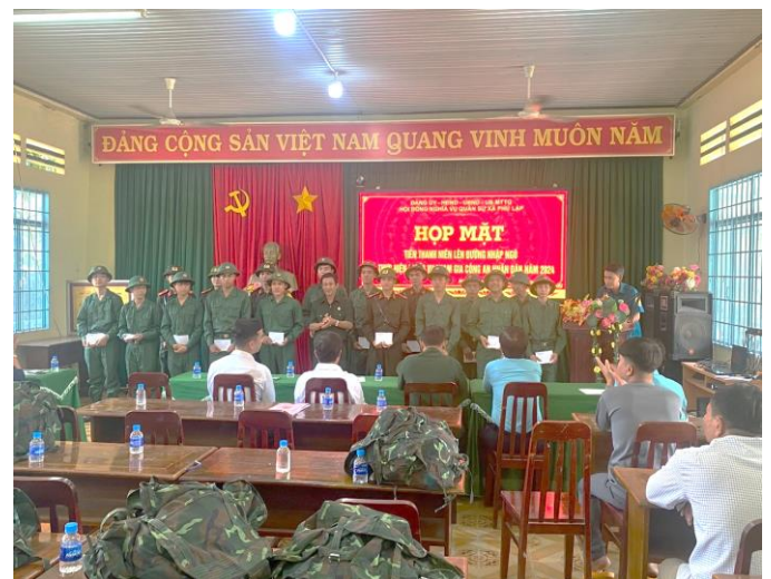
Xã Phú Lập họp mặt tiễn thanh niên lên đường nhập ngũ.

Với tinh thần đoàn kết, vui tươi, phấn khởi, an toàn, tiết kiệm, thăm tình quân dân. Qua đó, tuyên truyền giáo dục đoàn viên, thanh niên rèn luyện phẩm chất, đạo đức, tinh thần nhiệt huyết, đóng góp sức trẻ vào công cuộc xây dựng và bảo vệ Tổ quốc. Đến nay, công tác chuẩn bị cho hội trại tòng quân và lễ giao nhận quân năm 2024 tại xã Phú Lập cơ bản hoàn tất. Vào 12 giờ ngày 26/2, xã Phú Lập sẽ tổ chức lễ giao nhận quân năm 2024, phấn đấu hoàn thành 100% chỉ tiêu cấp trên giao./.