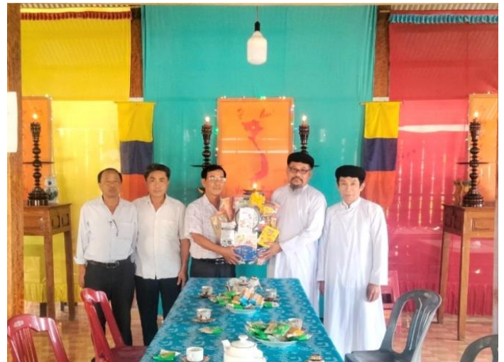
Đoàn lãnh đạo Đảng ủy- UBND xã Phú Lập thăm chúc tết cơ sở Tịnh thất Ngọc Lâm Tiên Đàn