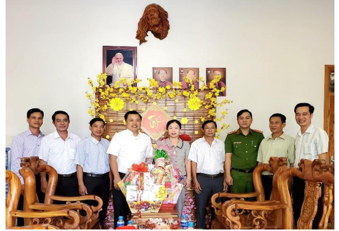
Đoàn lãnh đạo Đảng ủy- UBND xã Phú Lập thăm chúc tết Giáo xứ Thạch Lâm

Tại các nơi đến thăm, thay mặt đoàn, Trưởng các đoàn đã tặng quà và gửi lời chúc mừng năm mới an lành, hạnh phúc, đầm ấm, vui tươi đến các chức sắc, chức việc tôn giáo và đồng bào có đạo. Đồng thời, thông tin nhanh về tình hình phát triển Kinh tế - Xã hội của xã năm 2023. Mong muốn trong thời gian tới, các chức sắc, chức việc, tăng ni, phật tử, đồng bào có đạo tiếp tục phát huy tinh thần đoàn kết, tích cực tham gia các phong trào thi đua yêu nước, chấp hành tốt chủ trương đường lối của Đảng tích cực tham gia các hoạt động xã hội, sống “tốt đời, đẹp đạo”, góp sức xây dựng quê hương Phú Lập ngày càng giàu mạnh.