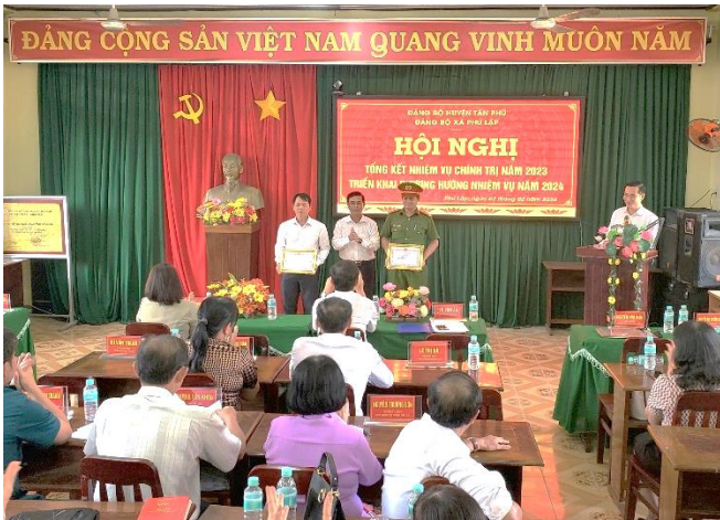
Đảng ủy khen thưởng các tập thể chi bộ HTSXNV năm 2023

Cũng trong dịp này, Đảng ủy đã khen thưởng cho 02 tập thể Chi bộ đạt HTSXNV và 19 Đảng viên HTSXNV năm 2023./.