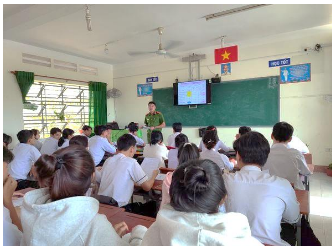
Công an xã Phú Lập đang tuyên truyền đến các em học sinh