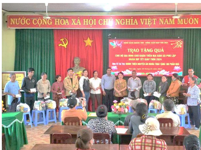
Nhóm thiện nguyện Ân Nghĩa tặng quà tết cho bà con

Trong buổi sáng, CLB thiện nguyện Ân Nghĩa đã trao 100 phần quà cho hộ nghèo, hộ khó khăn trên địa bàn gồm: Tiền mặt 50.000đ và Gạo, dầu ăn, nước mắm, bột ngọt, nước tương, bột giặt, nước rửa chén... mỗi phần quà trị giá khoảng 450.000đ; với 100 phần ước giá trị khoảng 45 triệu đồng. Đây là những phần quà mà Nhóm Thiện nguyện Ân Nghĩa gửi tặng đến bà con nghèo, bà con khó khăn nhằm chi sẻ, động viên bà con nhân dân đón Tết nguyên đán Giáp Thìn 2024.