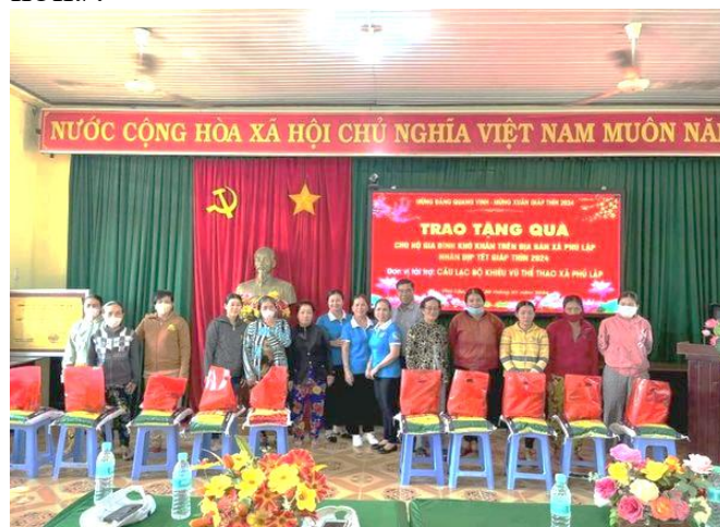
CLB khiêu vũ thể thao trao quà tết cho bà con

Phát biểu cảm ơn các Đơn vị tài trợ: Đ/c Chủ tịch UBND mong muốn trong thời gian tới địa phương và bà con nhân dân trong xã tiếp tục được đón nhận thêm sự quan tâm, sẻ chia của Đơn vị tài trợ. Mong muốn bà con cố gắng phấn đấu vươn lên thoát nghèo, đó tết đầm ấm, an toàn, tiết kiệm, vui tươi. Cùng địa phương xây dựng xã Phú Lập ngày càng văn minh, tốt đẹp hơn./.