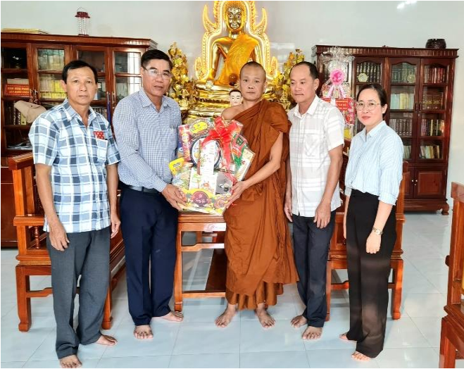
Đoàn lãnh đạo Đảng ủy- UBND xã Phú Lập thăm chúc tết cơ sở phật giáo.

Đại diện các cơ sở tôn giáo đã cảm ơn sự quan tâm, tạo điều kiện của Đảng ủy, HĐND, UBND, Ủy ban MTTQ Việt Nam xã Phú Lập đối với hoạt động của các tôn giáo, bày tỏ sự vui mừng trước những thành tựu phát triển KT - XH trong năm qua, tin tưởng Phú Lập sẽ gặt hái được nhiều thắng lợi trong năm mới Giáp Thìn; đồng thời sẽ tiếp tục vận động các chức sắc, tín đồ chấp hành tốt chủ trương, đường lối của Đảng, chính sách, pháp luật của Nhà nước, thực hiện hoạt động tín ngưỡng, tôn giáo theo đúng quy định của pháp luật và Điều lệ đã được Nhà nước công nhận, tham gia các phong trào thi đua yêu nước, góp sức xây dựng khối đại đoàn kết toàn dân, góp phần xây dựng quê hương, đất nước ngày càng phồn vinh./.