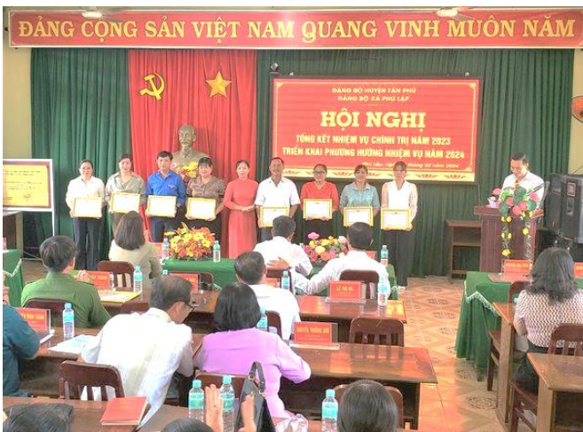
Đảng ủy khen thưởng các cá nhân HTSXNV năm 2023