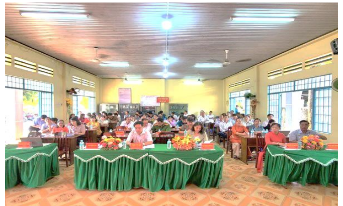
Quang cảnh buổi Họp mặt kỷ niệm

Với những thành tựu to lớn trong suốt 90 năm qua, đặc biệt là trong 35 năm đổi mới, nhân dân, dân tộc Việt Nam có quyền tự hào về Đảng Cộng sản Việt Nam - người lãnh đạo, người đầy tớ trung thành của nhân dân. Chúng ta có thể khẳng định rằng: được trang bị bằng chủ nghĩa Mác-Lênin, tư tưởng Hồ Chí Minh, được các tầng lớp nhân dân ủng hộ, tin và đi theo, Đảng Cộng sản Việt Nam có đủ bản lĩnh, trí tuệ, khả năng lãnh đạo nhân dân Việt Nam không chỉ thắng lợi trong đấu tranh giải phóng và chiến tranh giữ nước, mà cả trong xây dựng phát triển kinh tế, xây dựng đất nước theo mục tiêu: "Dân giàu, nước mạnh, xã hội dân chủ, công bằng, văn minh".