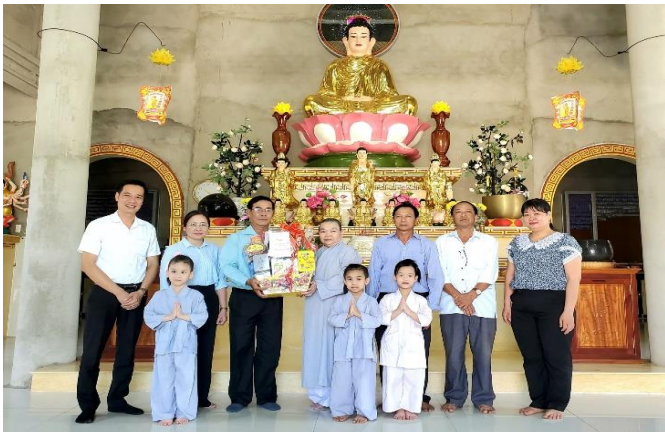
Đoàn lãnh đạo Đảng ủy- UBND xã Phú Lập thăm chúc tết cơ sở chùa Hồng Liên