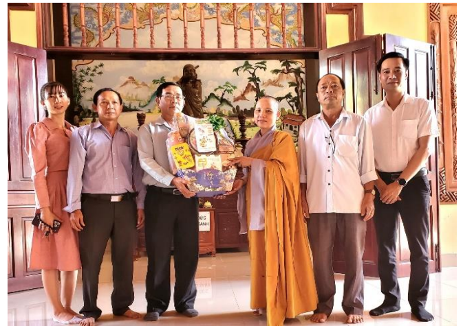
Đoàn lãnh đạo Đảng ủy- UBND xã Phú Lập thăm chúc tết cơ sở Chùa Trung Phú